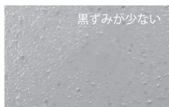
シーカ ビスコクリート ACE 390