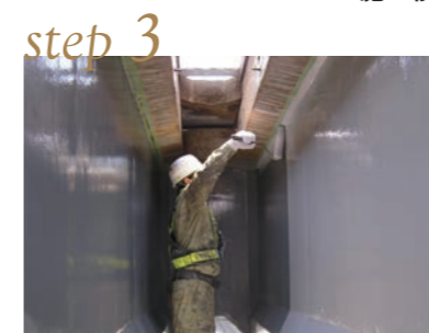
トップコート塗布