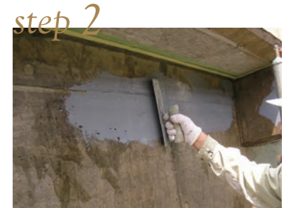
1成分形ウレタン塗布 (1~2回)