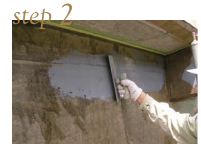
1成分形ウレタン塗布 (1~2回)