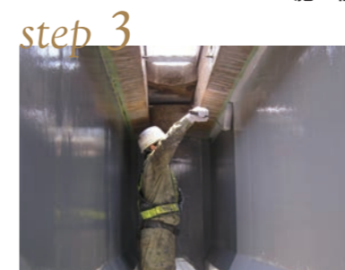
トップコート塗布