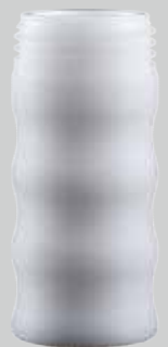
さざ波ノズル用 シャフト