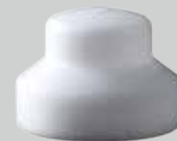
さざ波ノズル用 ヘッドチップ20mm