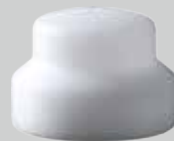
さざ波ノズル用 ヘッドチップ25mm

シーカ製品の適用および使用に関する情報および勧告は、当社の最新の知識および経験に従っているものであり、通常の条件下で適切に保管、処理および適用されることを前提としております。実際には材料、配合および現場の条件がそれぞれ異なるため、ここに記載されている情報、書面での勧告、その他のアドバイスは、商品性や特定目的への適合性について保証するものではなく、また、法的関係から生ずる責任をもたらすものでもありません。ユーザーは、シーカ製品がユーザーの使用目的および施工方法に適しているかをあらかじめ確認して下さい。当社は、製品の特性を変更する権利を留保します。第三者の権利は尊重されなければなりません。すべての注文は、当社の最新の販売・納品条件に従って受注されます。ユーザーは常に使用する製品のプロダクトデータシートの最新版に留意して下さい。プロダクトデータシートの最新版はご請求いただければ当社が提供いたします。著作権法により無断複写複製及び無断転載は禁止されています。